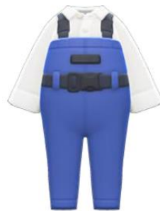
zdjęcie , autor: Nieznany