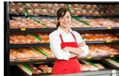
To zdjęcie , autor: Nieznany autor.